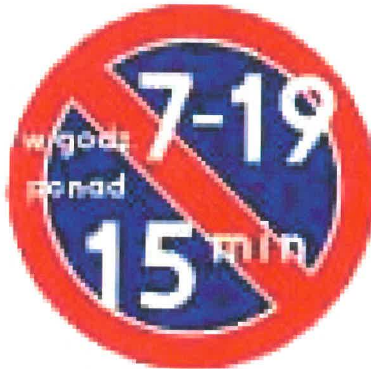
Rys. nr 2

Rys. nr 2 - Propozycja oznakowania - Napis podany na rysunku: oznacza, że w godzinach wymienionych na znaku, tj. od godz. 7.00 do 19.00 zabroniony jest postój trwający dłużej niż 15 minut, jednakże proponuję rozważyć czas 5 min. lub max. 10 min.