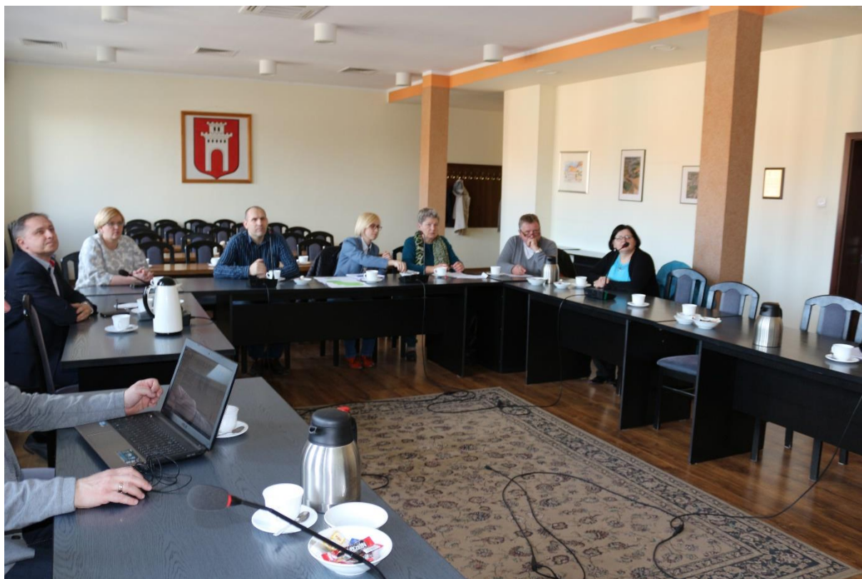
Rysunek 2. Spotkanie informacyjno – konsultacyjne w dniu 11.04.2017 r.