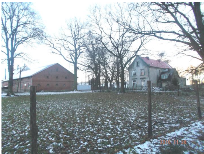
Fragment zespołu dworsko – folwarcznego