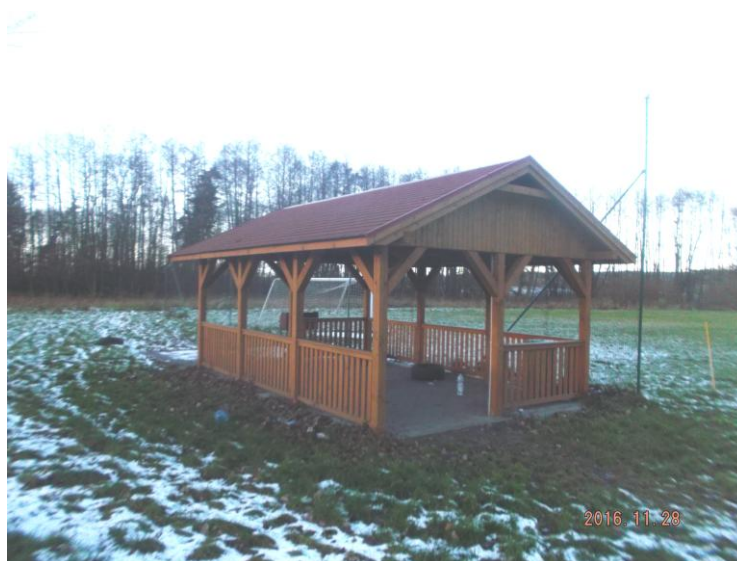
Wiaty wypoczynkowo – rekreacyjna