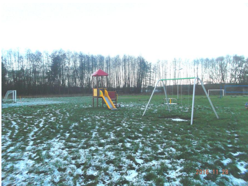
Plac zabaw i boisko

Infrastruktura społeczna to świetlica wiejska usytuowana w zabytkowym parku, plac zabaw wraz z boiskiem sportowym i wiatą wypoczynkowo-rekreacyjną – usytuowane w pobliżu świetlicy. Wszystkie te obiekty wymagają doposażenia w urządzenia lub w sprzęt (m.in. siłownię zewnętrzną, sprzęt gospodarstwa domowego, sportowo – rekreacyjnego itd.). Zaś plac zabaw, wiaty i boisko dodatkowo w sieć elektryczną.